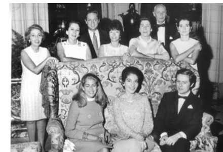
Van Brigitte Bardot en Coco Chanel tot Maria Callas en Roger Moore. Een bezoek aan Kasteel de Haar voelt als een reis naar de glorie-dagen van de twintigste eeuw.