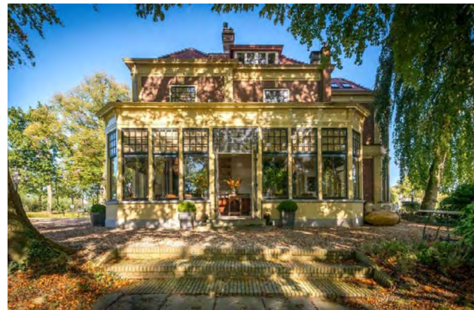
Ervaar de grandeur van rijke kooplieden in Logement aan de Vecht