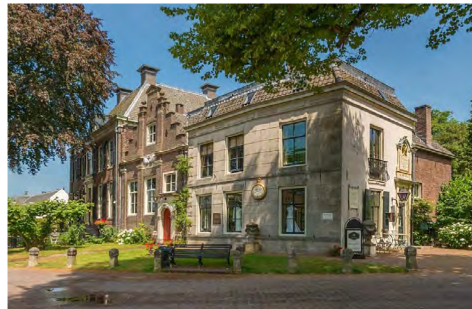
Bijzondere historische details zijn zichtbaar in het fraaie logement Swaenenvecht