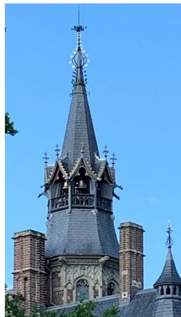
Figuur 3: Het carillon in de toren van het Châtelet.