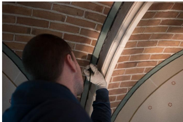
Figuur 1: Schildersbedrijf Hoogstraten aan het werk in het kasteel.

Naar verwachting zal de gehele kasteelrestauratie in het voorjaar van 2020 worden afgerond.