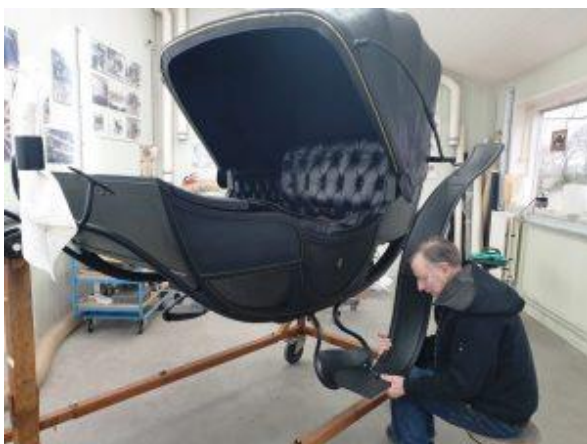
Figuur 2: Restauratie van de Calèche in restauratie-centrum Stolk.

In 2018 is tevens gestart met de restauratie van vier rijtuigen, voorheen in bezit van baron van Zuylen van Nijvelt van de Haar en thans in bezit van Stichting Paard en Karos. Stichting Kasteel de Haar heeft deze rijtuigen in bruikleen om - met behulp van VZW Natuurbehoud Pater David, Mondriaanfonds, VSB Fonds, Prins Bernhard Cultuurfonds en Stichting Bonhomme Tielens - te restaureren en vervolgens tentoon te stellen. Eind 2019 zijn twee rijtuigen reeds gerestaureerd en vorderen de werkzaamheden aan het derde rijtuig gestaag.